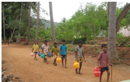
Afhentning af vand

Organisationen St. Joseph Development Trust (SJDT) driver en række børnehjem samt støtter en del hjemmeboende særligt fattige børn. I alt støtter Verdens Børn (VB) 486 børn. Projektet har været besøgt to gange i 2013 og børnene trives godt. Nogle større piger var blevet gift, og støtten til disse unge kvinder er derfor ophørt.