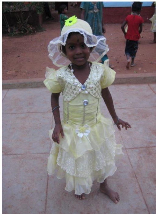
Dansepige i festdragt

Pudu Punal er et børnehjem for piger og småbørn af begge køn. Børnene er overvejende helt eller delvis forældreløse. Hjemmet huser 160 børn, herunder 32 små drenge.