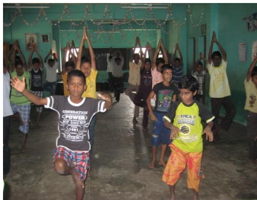
Gadebørn, der danser