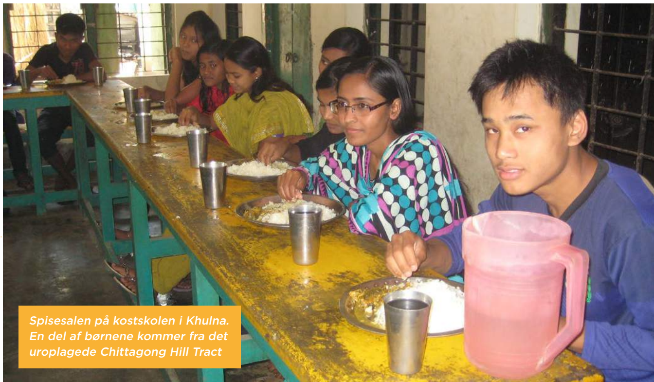
Spisesalen på kostskolen i Khulna. En del af børnene kommer fra det uroligede Chittagong Hill Tract