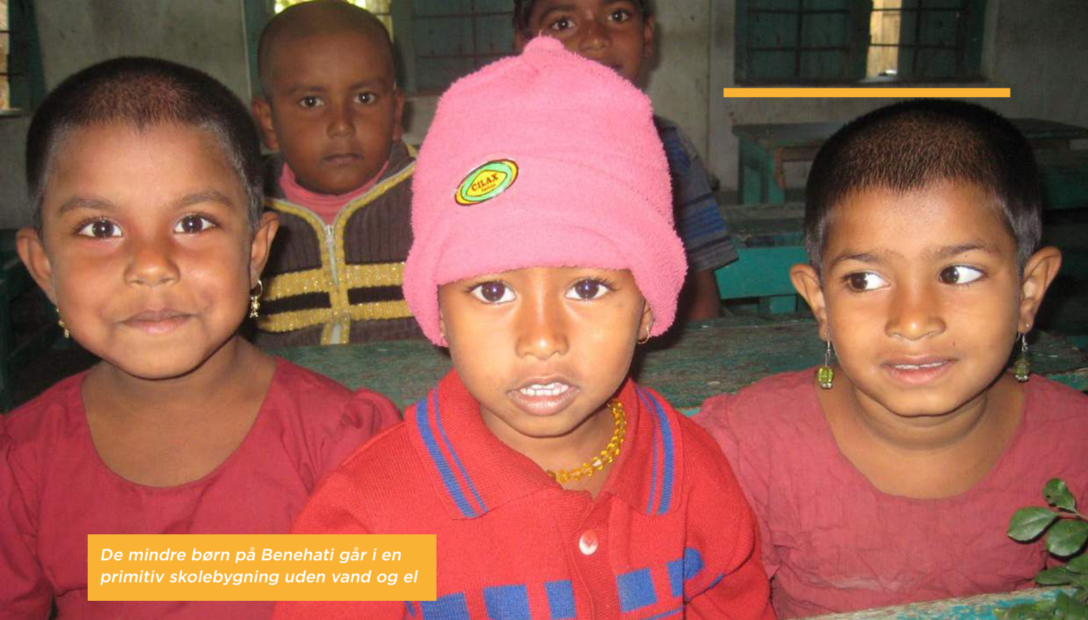
De mindre børn på Benehati går i en primitiv skolebygning uden vand og el