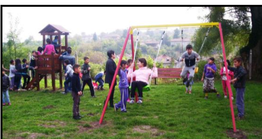
Den nye legeplads på sportspladsen i Mechka