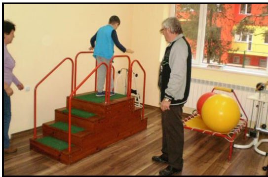
Det nye terapirum i Lukovit