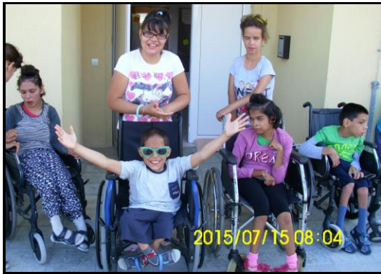
Nu skal vi på udflugt !