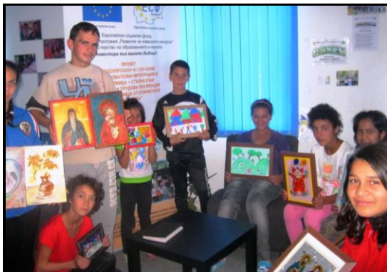
Egne værker vises stolt frem