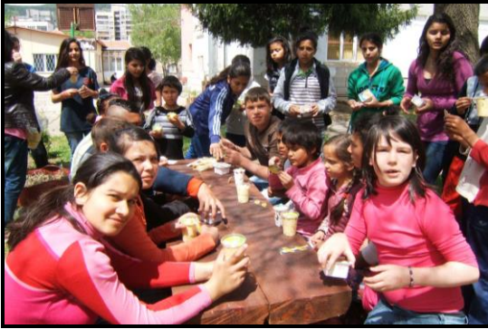
Is til alle