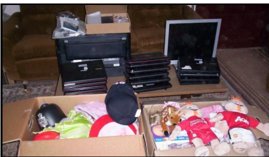
Julegaver fra Danmark