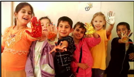
Glade børn i Mechka viser fingermaling