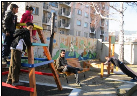
Den nye lejeplads i Dupnitsa er taget i brug