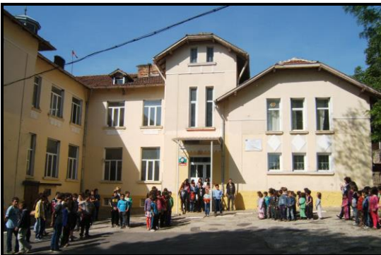
Velkomst i Mechka