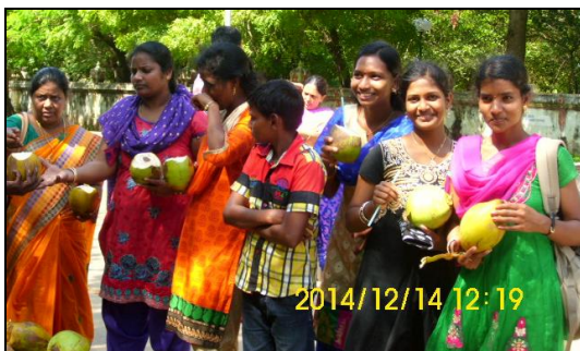
Forfriskning på vejen: Kokosnød med sugerør