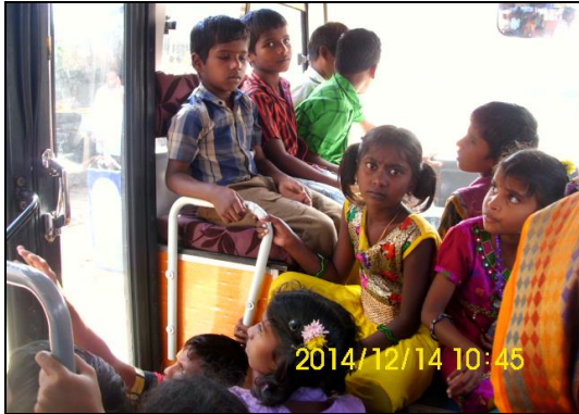
Den lange bustur fra V. Sithur til Trankebar