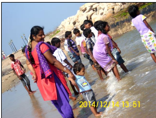
Børnene oplever havet for første gang i deres liv