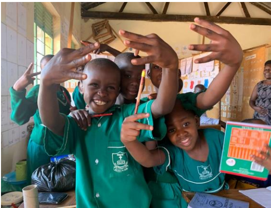
Gruppeordning for børn med hørehandicaps