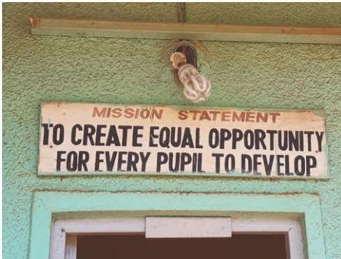
Seeta CUPS mission