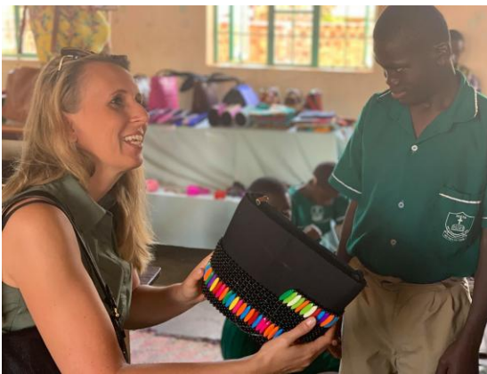
Verdens Børns første fadderbarn på Seeta CUPS viser stolt sit arbejde frem