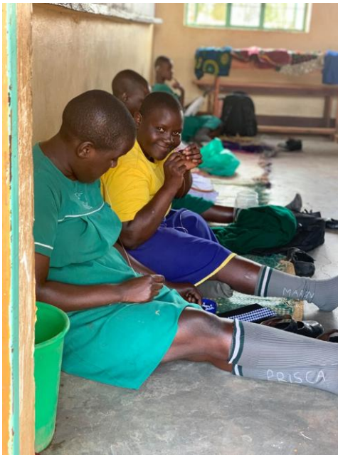
Gruppeordningen for børn med udviklingshandicaps laver håndarbejde