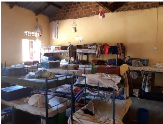
Sovesalen for piger på Seeta CUPS