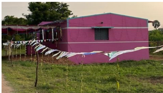
Den nye sundhedsklinik på åbningsdagen