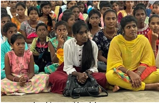
men som bor hjemme i landsbyerne.