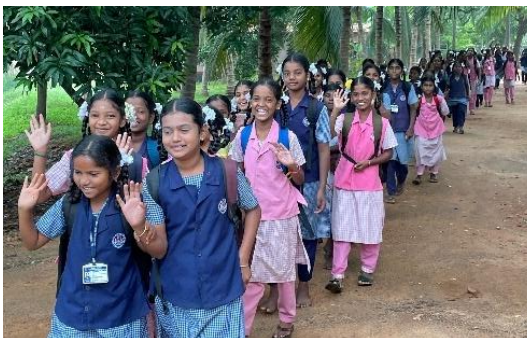
Hver morgen afgang mod skolen