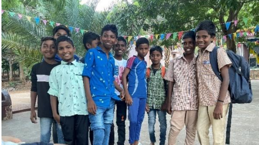
Drengene, der er blevet for gamle til at bo på børnehjemmet og derfor har kostskoleplads