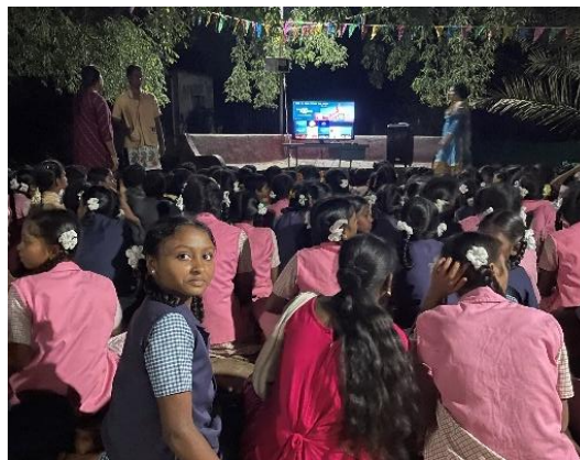
Filmaften på pladsen. Indiske superstjerner/-helte i Bollywood komedier